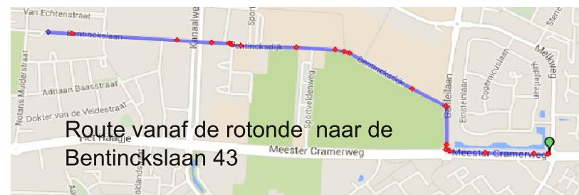
Route vanaf de rotonde naar de Bentinckslaan 43